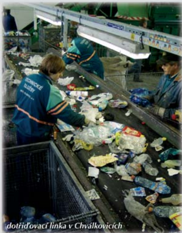
dotřídovací linka v Chválkovicích

O vyřídění suroviny mají odběratelské firmy zájem pouze pokud jsou v potřebné kvalitě. Technické služby města Olomouce, a. s. proto zprovoznily v roce 2003 linku, na které se vyříděné suroviny manuálně dotřídí. Přesto se může stát, že obsah kontejnerů obsahuje tolik nečistot, že je nelze dotřídít a skončí na skládce komunálního odpadu. Kvalitním předtříděním v barevných kontejnerech se podobné situaci zabrání a také se sníží náklady na svoz tříděného odpadu.