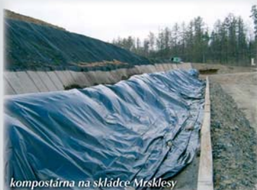
kompostárna na skládce Mrsklesy

Technické služby města Olomouce, a. s. v loňském roce zahájily zkušební provoz kompostárny v areálu skládky v Mrsklesích. Zatím se zde kompostují odpady z údržby veřejné zeleně a také organické odpady z některých supermarketů.