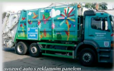
svozové auto s reklamním panelem

Svozová vozidla jsou nyní označena reklamními panely podle druhu odpadu, který svázejí.